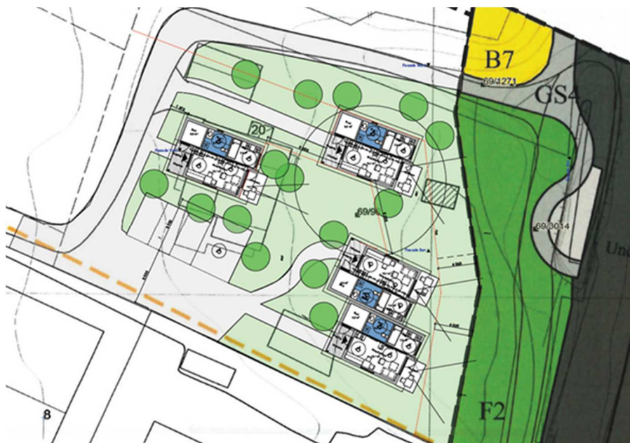
Illustrasjon av omsøkt byggeprosjekt med 4 Småhus