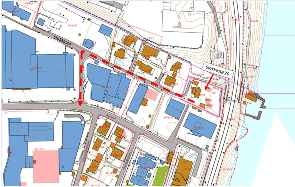
Alt.2 viser tilkobling til Sjøveien over tomt (69/1879) i sør, rødt markerer båndlagt areal ved liggerett.